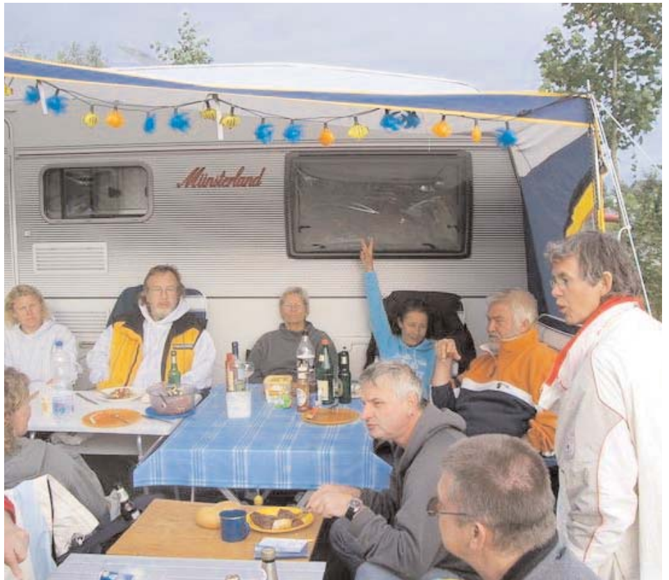
Nach dem Tauchen braucht der Körper wieder Energie, Grillen sorgt für Nachschub

Unsere Tagesgäste kamen dann auch am Vormittag. Ein reges Treiben