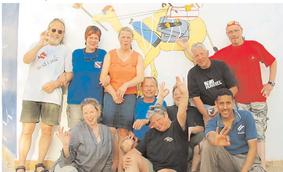
Die Cluburlauber im sonnigen Safaga. Man könnte fast neidisch werden.