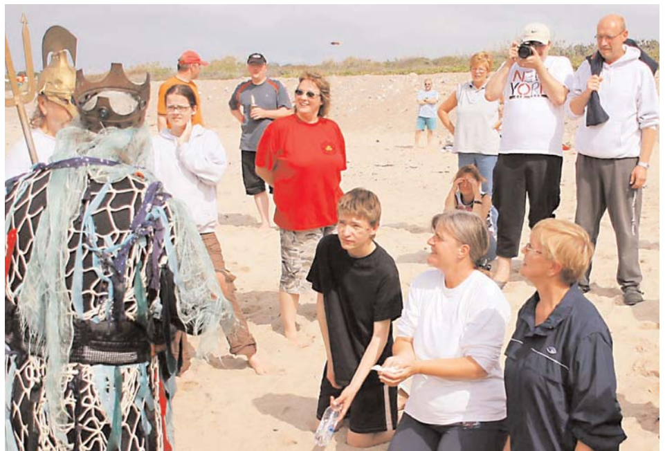
Der Empfang von Neptun am Ostseestrand

dieses Jahr hatten wir Pfingsten leider mal wieder kein so gutes Wetter. Doch ca. 40 Mitglieder hat es trotzdem nicht davon abgehalten mit uns Pfingsten zu verbringen. Wir haben unsere Beginner getauft, Chili gegessen und haben in den regenfreien Stunden (es gab auch etwas