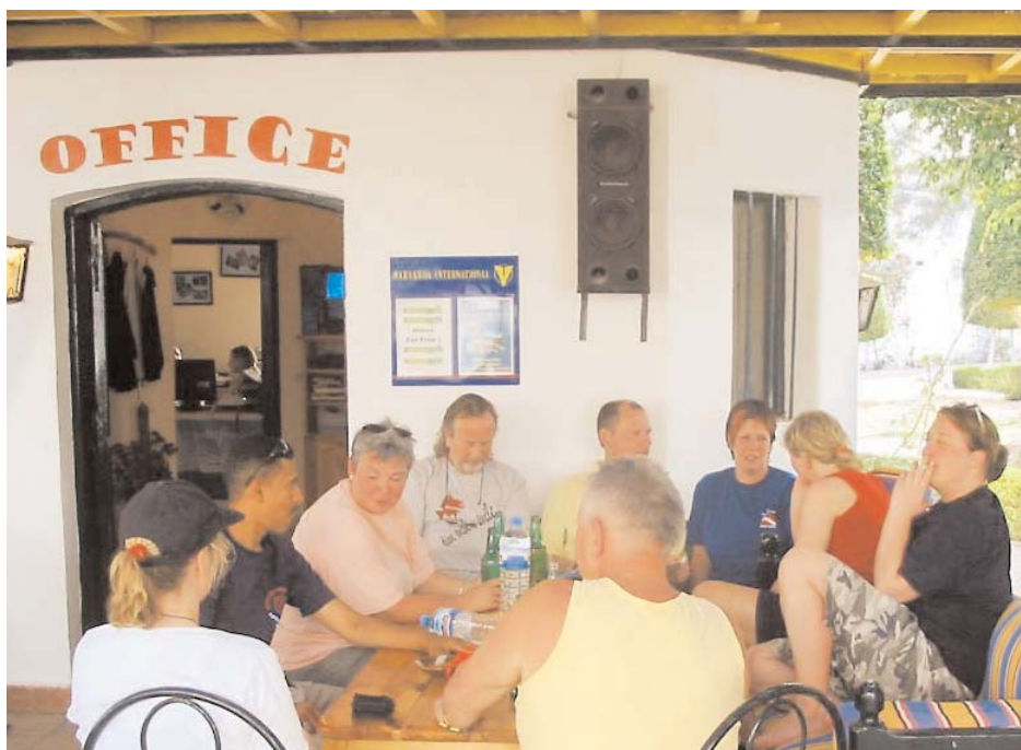
Rotes Meer: Ein kühler Schluck nach dem Tauchtag wirkt Wunder