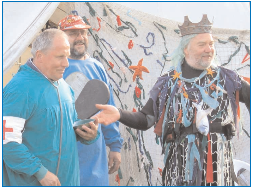
Neptun und seine Berater frohlocken aufgrund des bevorstehenden Festaktes.

Wichtig war diese Jahr; es gab für uns einen neuen Standplatz. Eine große, recht ruhige Wiese, ( Bomblitzer Wiese ) die direkt mit den Mietwohnanhängern zusammen hängt. Durch die kurzen Wege ging niemandem von den Aktivitäten etwas verloren. Unser Zusammensein auf einem Platz erreichte dadurch wieder einen größeren